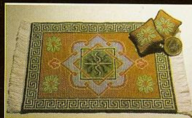
Il Tappetino Volante - scala 1:12, fatto a mano by Barbara Renzi