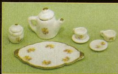
Servizio da tè in scala 1:12 fatto a mano by Roberta Solari Le Miniature di Eurosia

-HOBBY MODEL EXPO. Settembre 2007- Novero (MI) www.parcosposizioninovegro.it