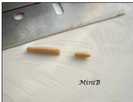
FOTO 7: Rollate un poco di Fimo color Champagne e tagliatene un piccolo pezzo. Questo sarà il gambo del fungo e le sue dimensioni varieranno a seconda della grandezza del cappello.