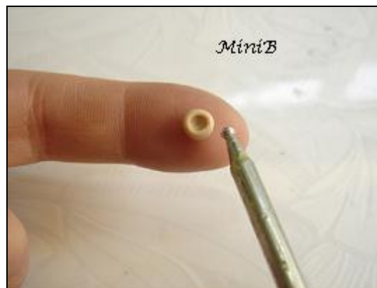
FOTO 2: Usate l'attrezzo per modellare a punta rotonda per incidere la vostra pallina di Fimo, avrete ottenuto il cappello del fungo. Fatelo sul dito o su materiale morbido, altrimenti la parte inferiore anziché arrotondata verrà piatta.

FOTO 1: Prendete una porzione di pasta sintetica color Champagne e formate una pallina di circa mezzo centimetro di diametro (fatene di diverse dimensioni).