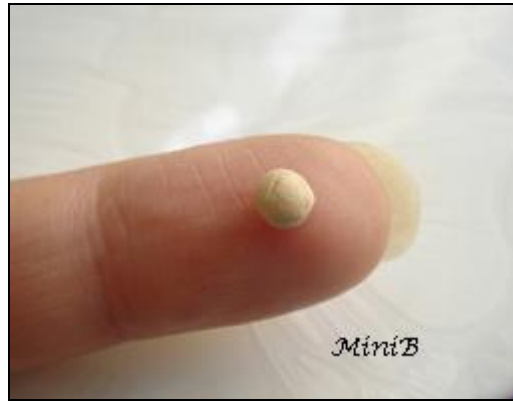
FOTO 1: Prendete una porzione di pasta sintetica color Champagne e formate una pallina di circa mezzo centimetro di diametro (fatene di diverse dimensioni).