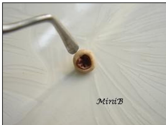
FOTO 6: Usate adesso l'attrezzo a punta piatta e incidete alcune linee incrociate a imitare le lamelle.