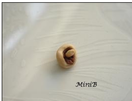
FOTO 8: Inserite il gambo ottenuto nel centro del cappello. Cercate di modellare ogni fungo leggermente diverso dal precedente, date angolazioni differenti ai gambi.

FOTO 7: Rollate un poco di Fimo color Champagne e tagliatene un piccolo pezzo. Questo sarà il gambo del fungo e le sue dimensioni varieranno a seconda della grandezza del cappello.