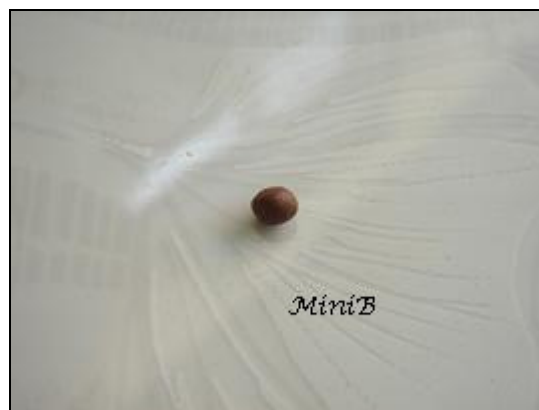
FOTO 3: Seguite il medesimo procedimento della FOTO 1 con la pasta sintetica color Terracotta. Fate una pallina più piccola della precedente.

FOTO 2: Usate l'attrezzo per modellare a punta rotonda per incidere la vostra pallina di Fimo, avrete ottenuto il cappello del fungo. Fatelo sul dito o su materiale morbido, altrimenti la parte inferiore anziché arrotondata verrà piatta.