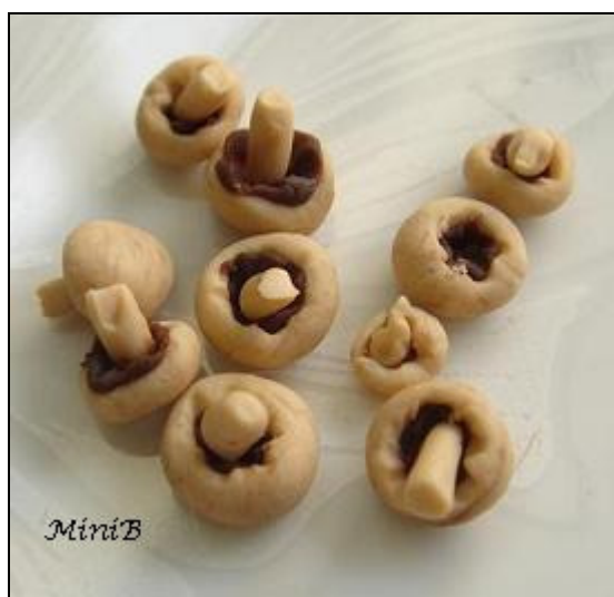
FOTO 9: Ecco l'insieme dei funghi finiti. Volendo, potete sporcare con un poco di acrilico marrone o con polvere di gessetti da artista la base del gambo a imitare la terra. Cuocete la pasta sintetica in forno a circa 130° per 20 minuti.////

FOTO 8: Inserite il gambo ottenuto nel centro del cappello. Cercate di modellare ogni fungo leggermente diverso dal precedente, date angolazioni differenti ai gambi.