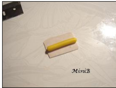
FOTO 4: Al centro del rettangolo ottenuto, inserite il rotolino di Fimo giallo della foto 1.