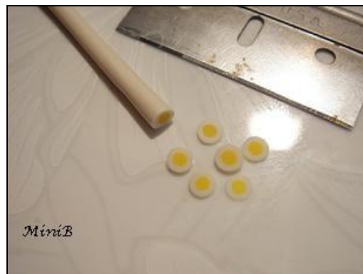
FOTO 7: La vostra murrina è pronta. Potete cuocerla in forno a 130° per 20 minuti //