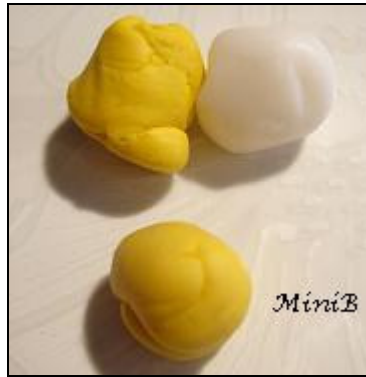
FOTO 1: Miscelate il Fimo traslucido con poco Fimo giallo. Nella misura di 10:4.