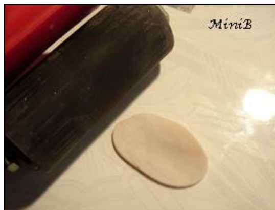
FOTO 2: Prendete il Fimo bianco e, con l'aiuto del rullo o di un tubo, stendetelo in una sfoglia sottile non troppo grande. Spessa qualche millimetro.