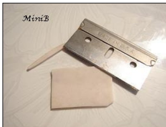
FOTO 3: Con la taglierina riducete la sfoglia a un rettangolo di circa 3cm di larghezza.